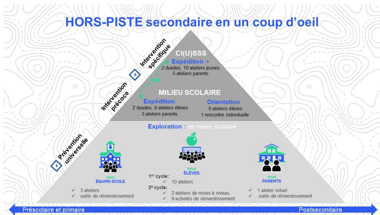
Figure 1. Le programme HORS-PISTE secondaire en un coup d'œil

HORS-PISTE est une initiative du Centre RBC d'expertise universitaire en santé mentale. Il vise à permettre aux jeunes de mieux composer avec leurs défis développementaux afin de prévenir l'apparition de symptômes liés aux troubles anxieux et à d'autres troubles d'adaptation par le développement de leurs compétences psychosociales et l'établissement d'un environnement scolaire sain et bienveillant. Initialement composé d'un volet de prévention universelle s'adressant aux élèves du 1 er cycle du secondaire, le programme HORS-PISTE secondaire compte aujourd'hui différents volets allant de la prévention universelle à l'intervention spécifique. De plus, différents programmes touchent maintenant l'ensemble les élèves tout au long du parcours scolaire : du préscolaire/ primaire, au secondaire jusqu'au postsecondaire.