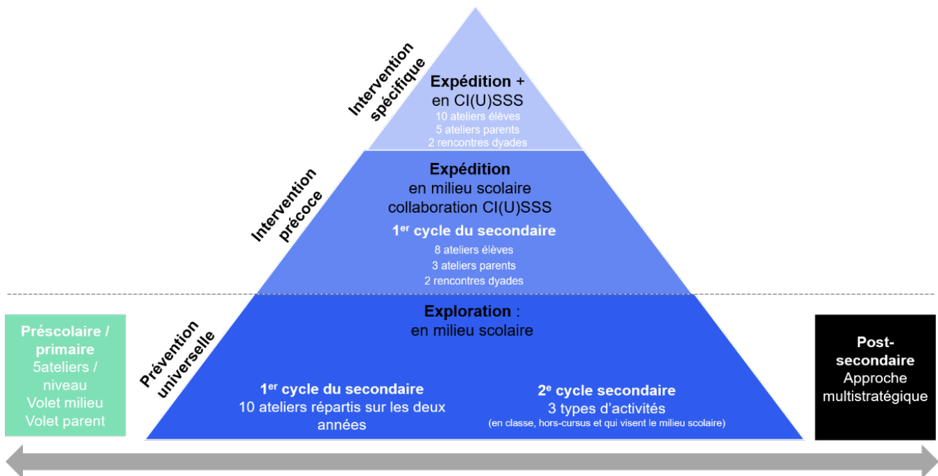
Figure 1. Le programme HORS-PISTE en un coup d'œil

Le programme HORS-PISTE est une initiative du Centre RBC d'expertise universitaire en santé mentale. Ce programme vise à permettre aux jeunes de mieux composer avec leurs défis développementaux afin de prévenir l'apparition de symptômes liés aux troubles anxieux et à d'autres troubles d'adaptation par le développement de leurs compétences psychosociales. Initialement composé d'un volet de prévention universelle s'adressant aux élèves du 1 er cycle du secondaire, le programme HORS-PISTE compte aujourd'hui différents volets, allant de la prévention universelle à l'intervention spécifique et touchant les élèves du préscolaire et du primaire, du secondaire et les étudiants.es. du postsecondaire.